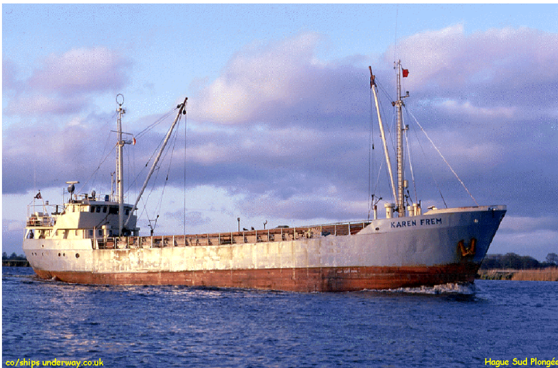
Le Karen Frem futur Karen Folmer

C'est donc en 1998 qu'une équipe de plongeurs amateurs expérimentés se lance dans l'aventure. Des conditions idéales doivent être nécessaires : une marée à faible coefficient, pas de vent donc une mer calme et en plus un beau soleil.