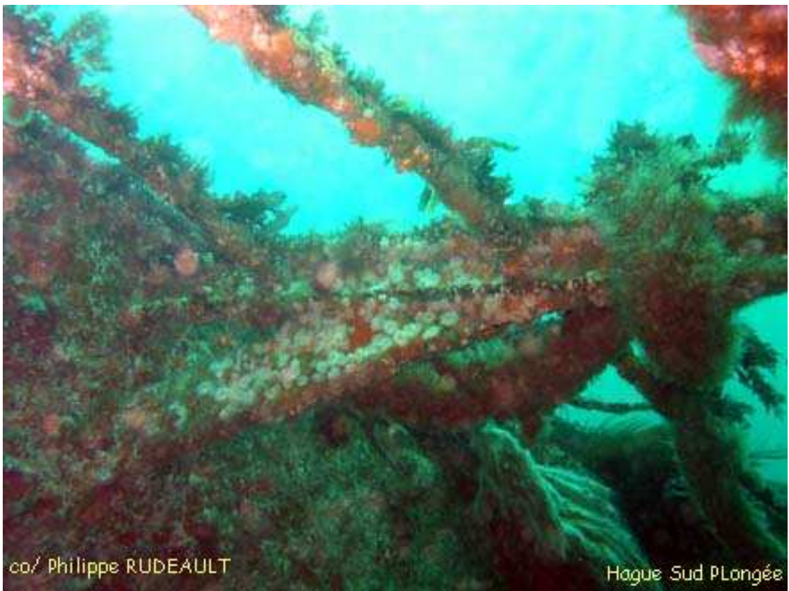
Le bastingage supérieur