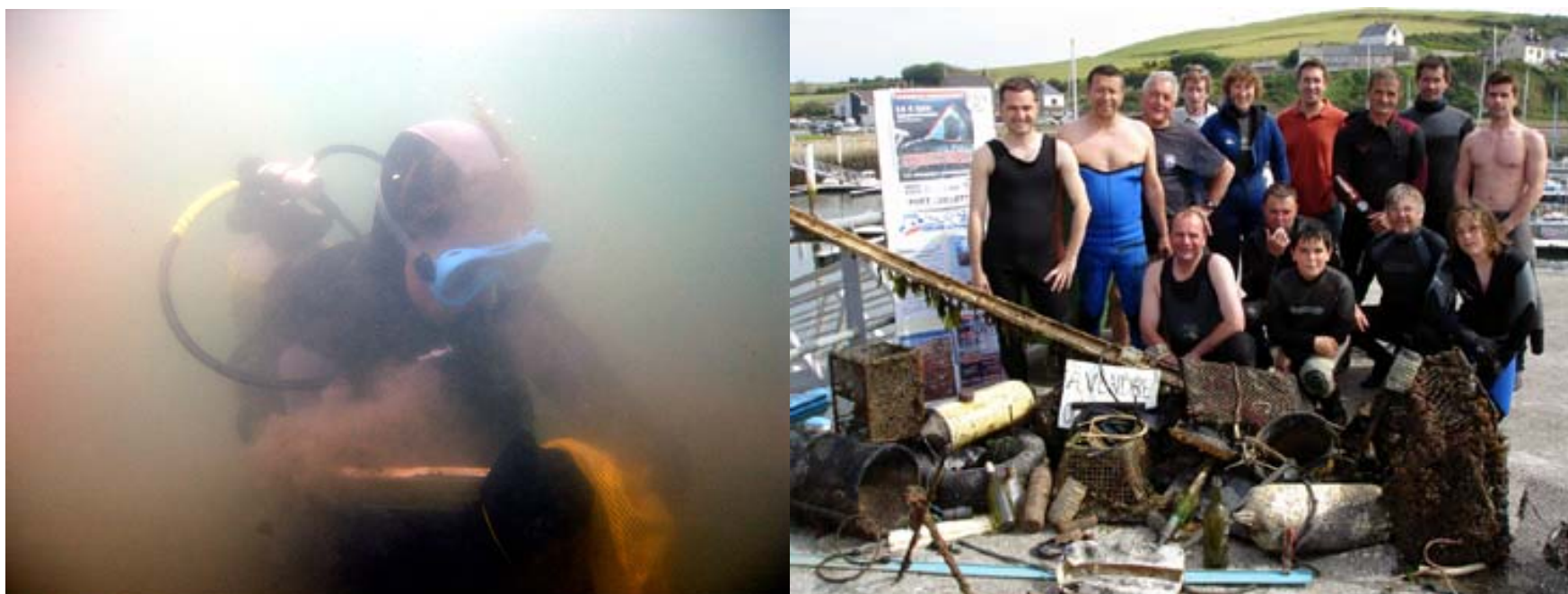
Journée de Mondiale de l'Environnement à Diélette en 2006 ...